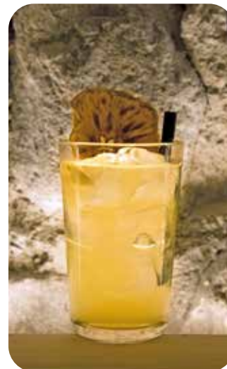
REGINA DEL GARDA

Rum Jamaica, Lime, Zucchero, Pimento, Angostura